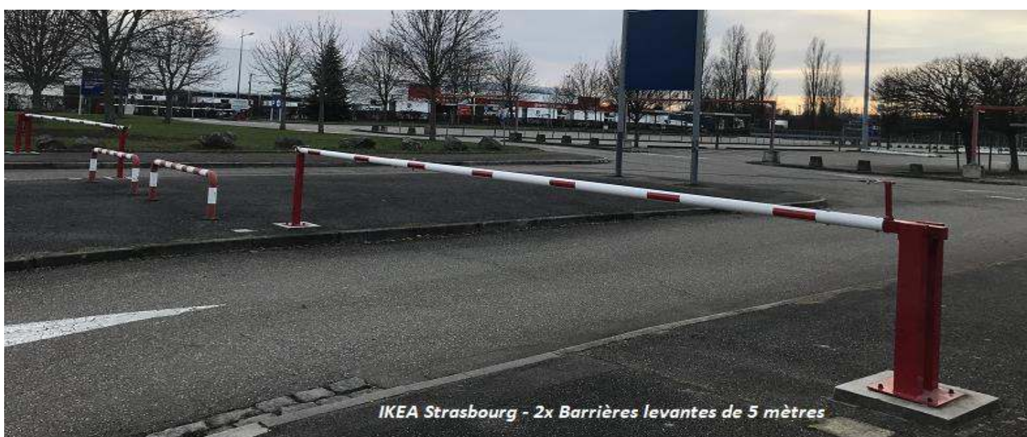
IKEA Strasbourg - 2x Barrières levantes de 5 mètres